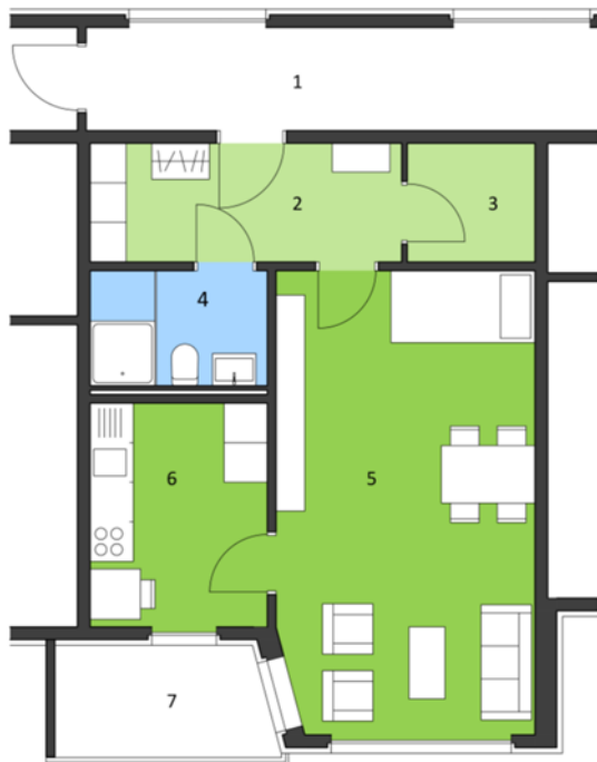
Mustergrundriss 1 ½ Zimmerwohnung

Alle Wohnungen verfügen über einen Balkon, sind rollstuhlgängig und mit einem behindertengerechten Bad ausgerüstet. Die meisten Küchen sind mit einem Glaskeramik-Kochfeld und einem Geschirrspüler ausgestattet. Alle mit Ausnahme der 3½-Zimmer-Wohnung sind per Lift erreichbar. Eine Garage kann auf Anfrage dazu gemietet werden.